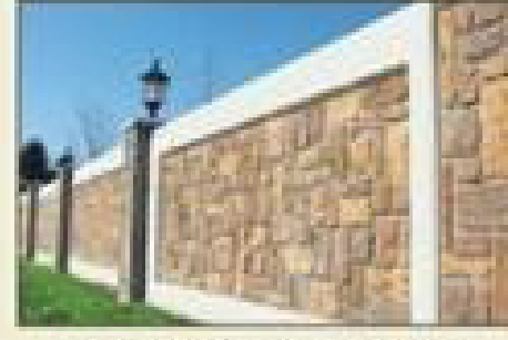
बाऊंड्री वॉल से घिरा हुआ सुरक्षित कैम्पस