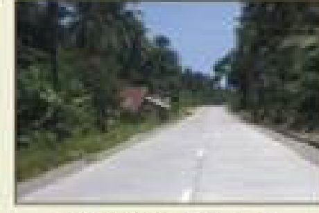
चौड़ी सीमेंट की सड़कें